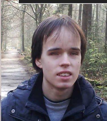
Lucas / Redactie