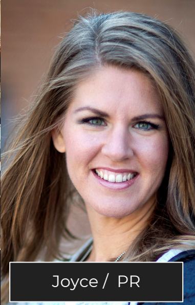
Joyce / PR