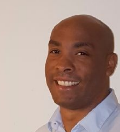
Paul / Partnerships